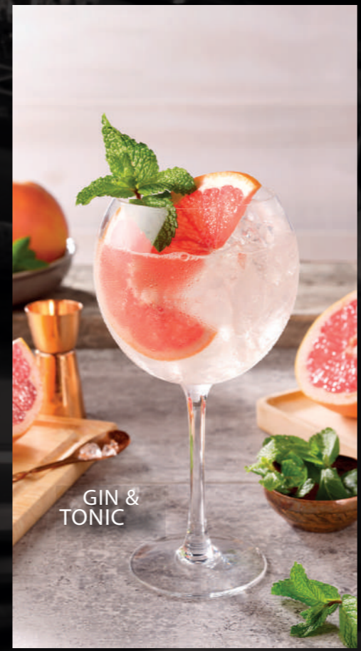
GIN & TONIC

STRAWBERRY DAIQUIRÍ Ron Premium, fresas, Fresh Sour Rocks.