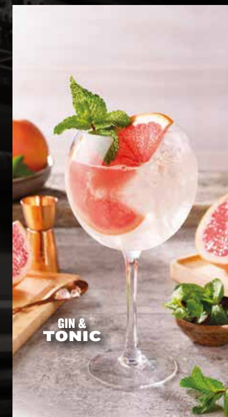
GIN & TONIC