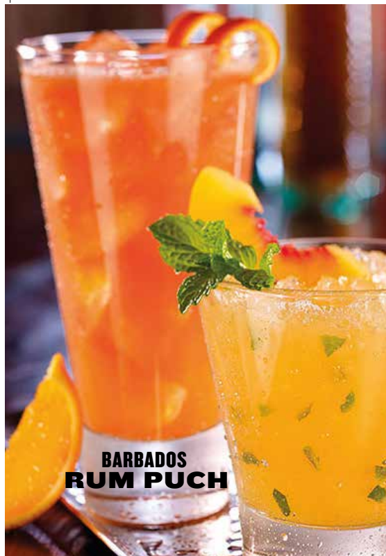
BARBADOS RUM PUNCH