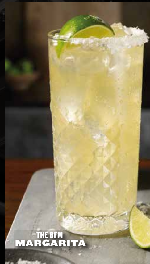
THE BFM MARGARITA